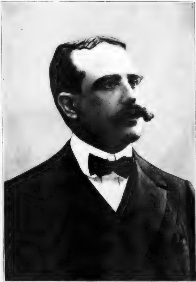
DOCTOR DON JOSÉ PARDO, PRESIDENTE DEL PERÚ.